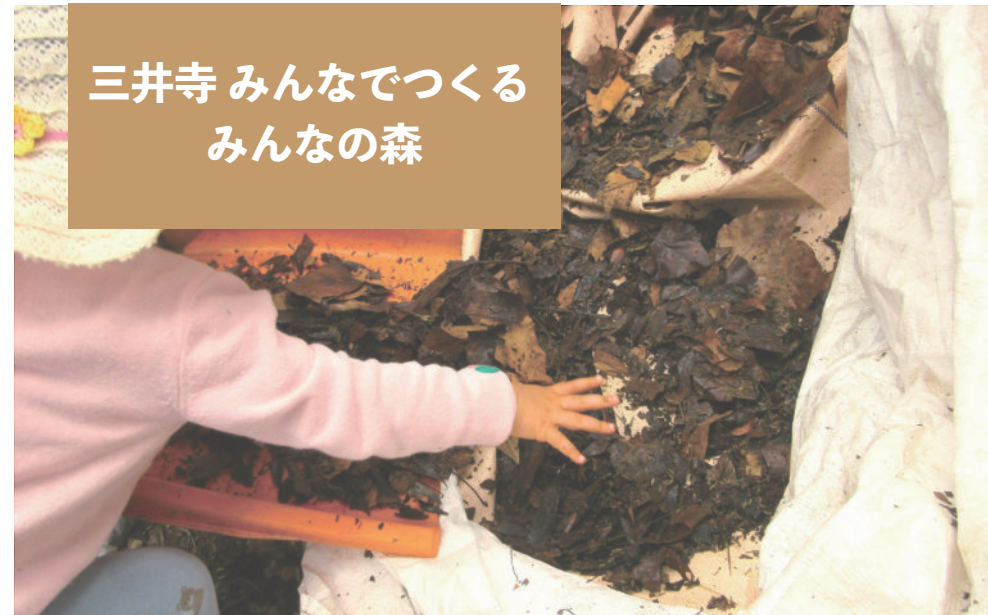
三井寺 みんなでつくる みんなの森