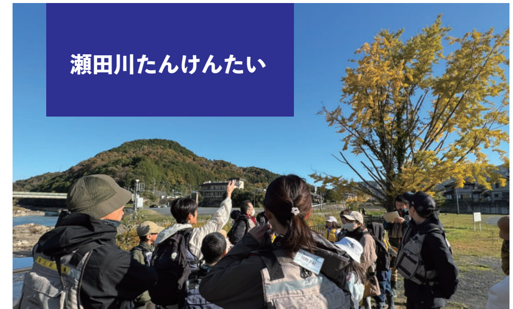
瀬田川たんけんたい