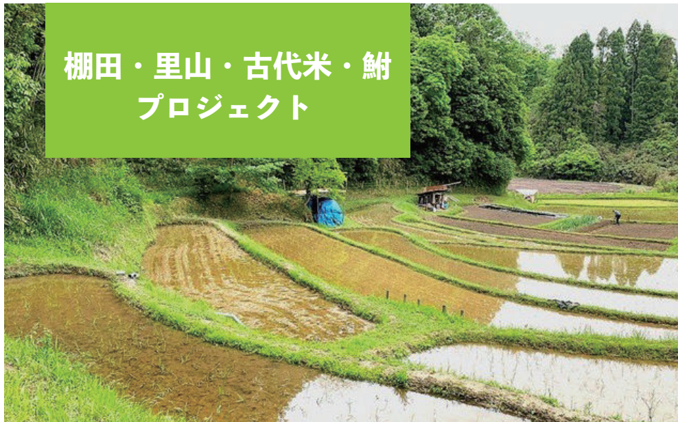
棚田・里山・古代米・鮎プロジェクト