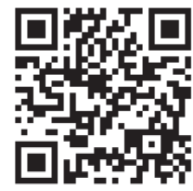
プロジェクト公式サイト

2024年度も皆様のおかげで目標を上回る金額を寄付することができました。皆様のご協力に深く御礼申し上げます。2025年度もより一層良いプロジェクト運営ができる様、スタッフ一同精進して参りますのでお力添えの程、宜しくお願いたします。