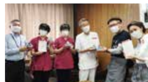
コロナとたたかう病院への差し入れ