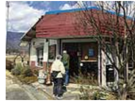
11時には次々にお客様が来店

湖西線も蓬萊の駅を北に進むと、電車は琵琶湖にぐっと迫ります。比良山の頂に雪をちょっと被りながら、春の柔らかな日差しと湖面の煌めきが車窓に届き、えり漁の杭が浮かぶ対岸には沖島や伊吹山も臨めます。湖西線の比良駅を降りると、目の前に「ほっとすていしょん比良」の赤いお屋根がお出迎え。お店のテラス席では風景を味わいながらお弁当や料理をのんびりいただけます。