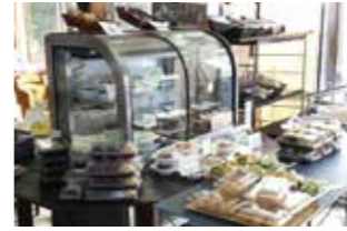
お惣菜やお菓子も所狭しと並びます