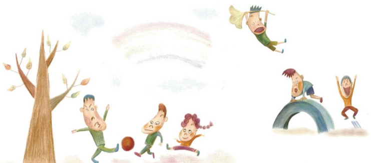
イラスト：プロジェクトサポーターM