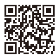
プロジェクト公式サイト

大津市市民活動センターでご提供しているお菓子などをお求めいただいたお金や、イベントの収益は必要経費を除いた金額は、当プロジェクトで採択された「平和」や「公正な社会づくり」を進める大津市内の市民公益活動団体に寄付いたします。皆様の一年間のご協力、深く御礼申し上げます。