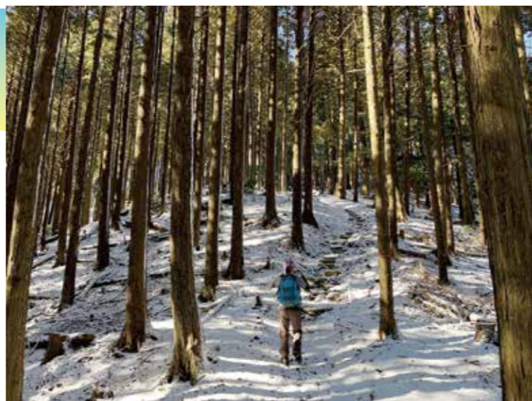
大比叡：雪景色を楽しみながら山道を進みます。