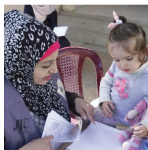
日本国際ボランティアセンター パレスチナガザ地区「子どもの 栄養失調予防・改善」事業