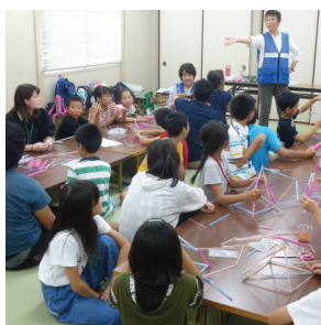
大津夜まわりの会 「2020年夏休み子ども ひまわりの家」事業